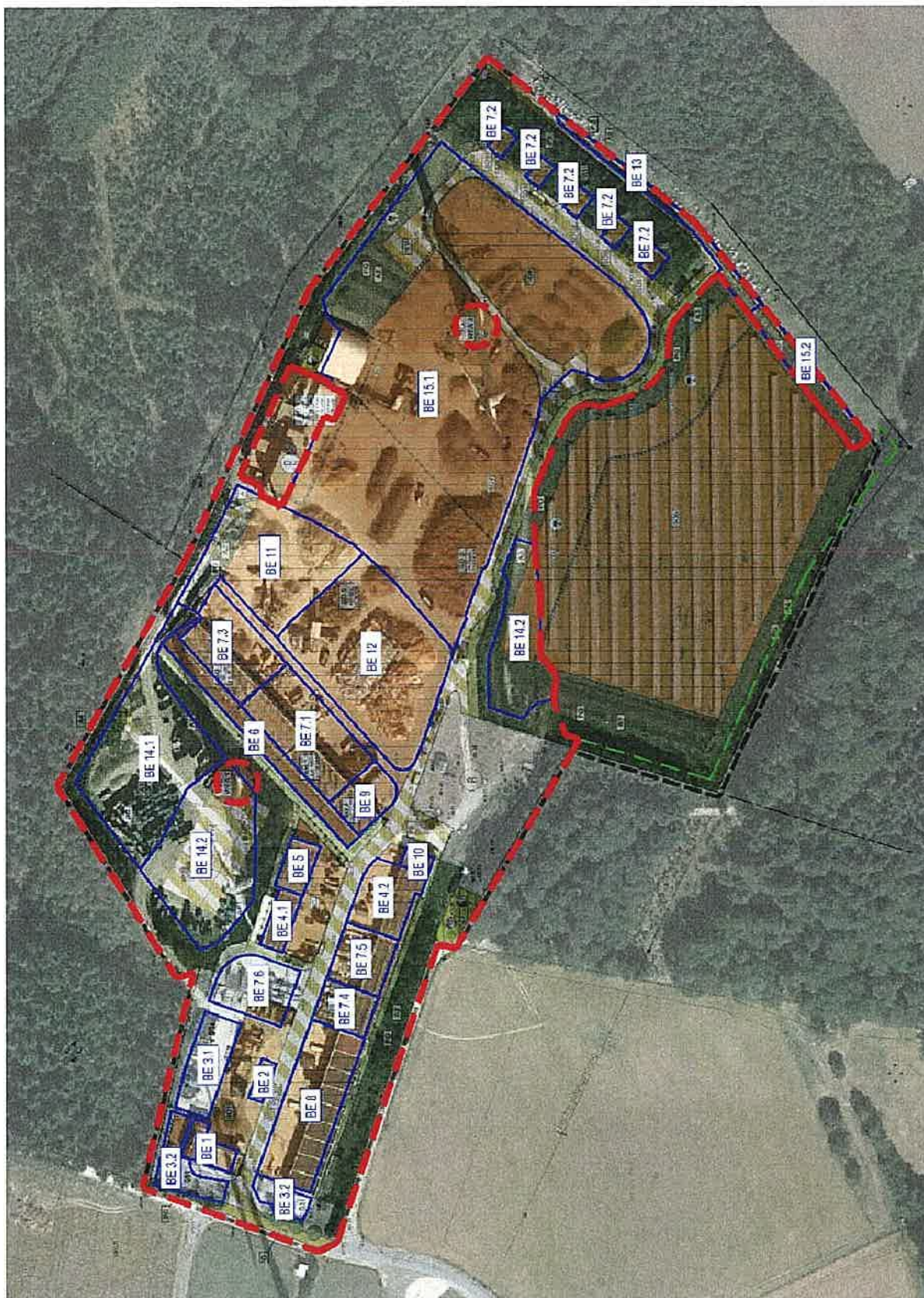
Lage der Betriebseinheiten (BE) aus Änderungsantrag gem. § 16 BImSchG