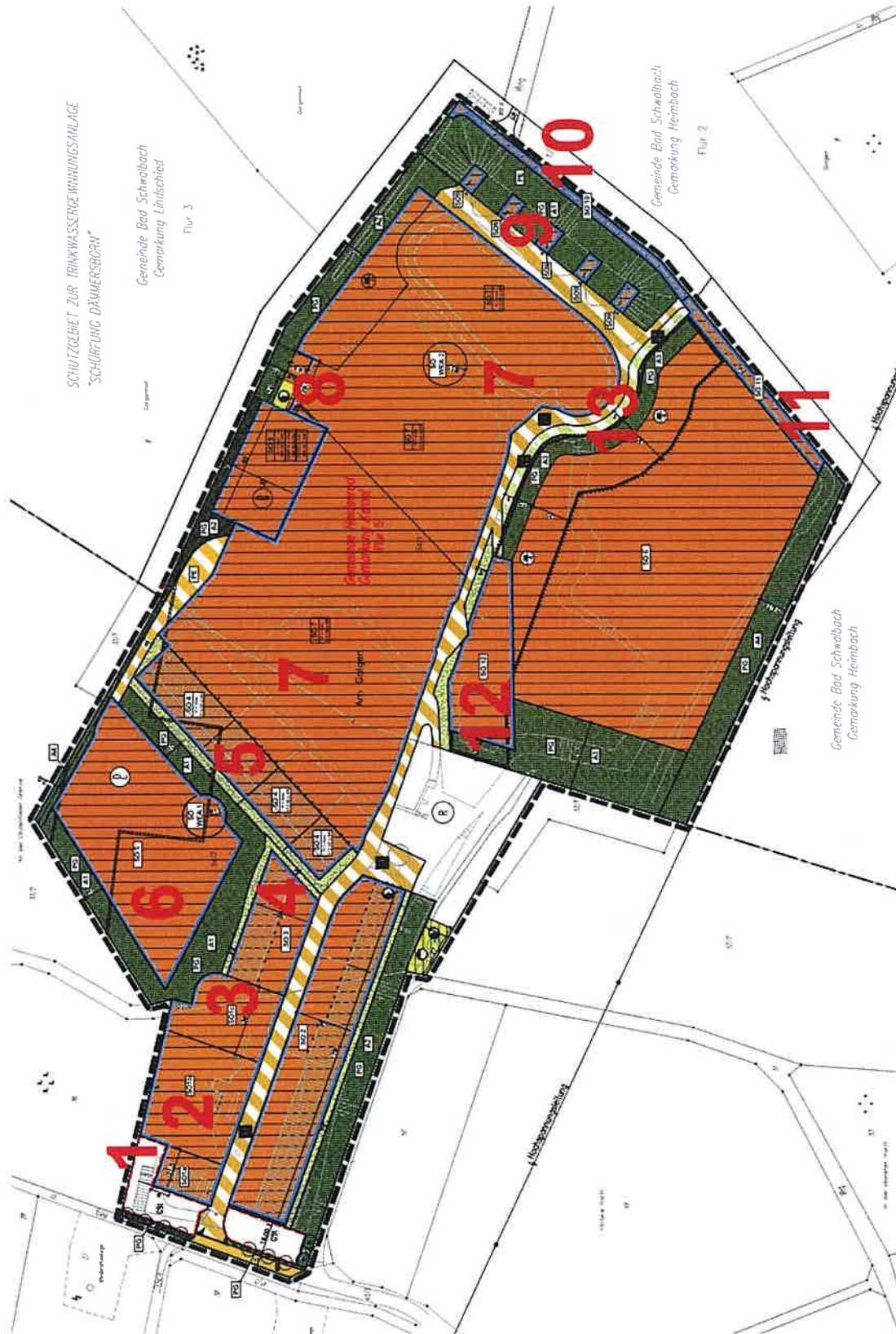
Übersicht über die Lage der Einzeländerungen des Bebauungsplanes